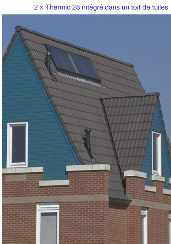
2 x Thermic 28 intégré dans un toit de tuiles