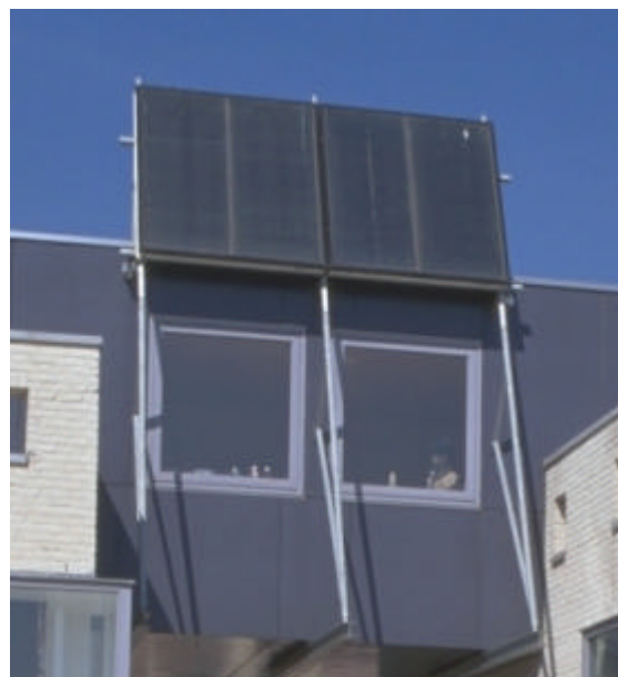
2 x Thermic 28 sur un châssis de façade adapté (surface totale: 5,5 m 2 )