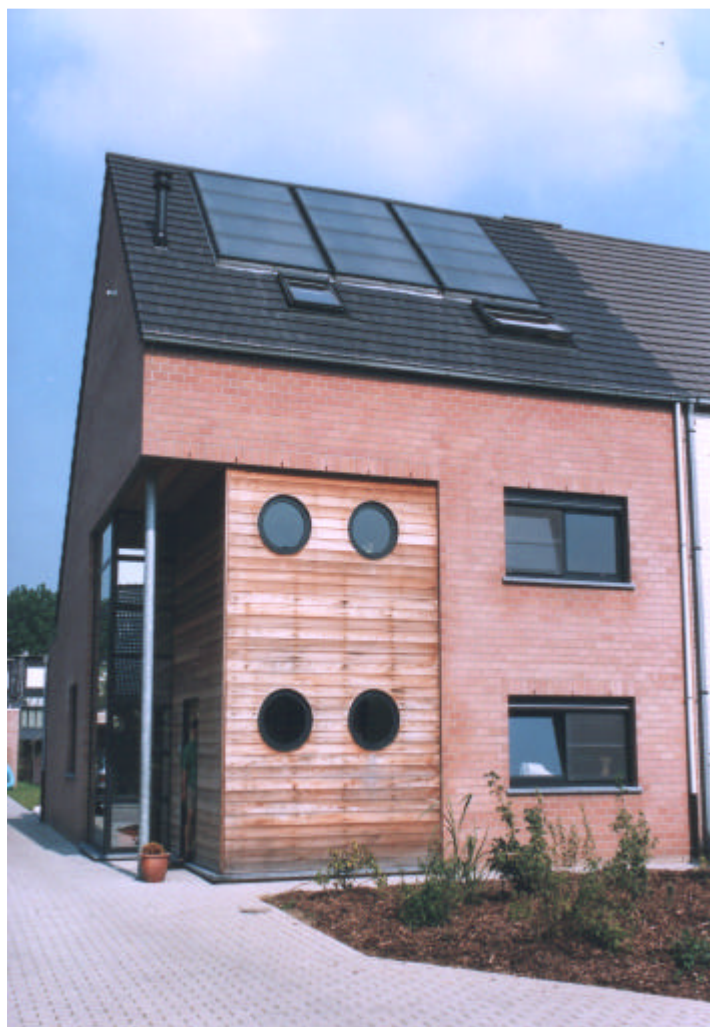
3 x Thermic 56G intégré dans un toit de tuiles ardoises